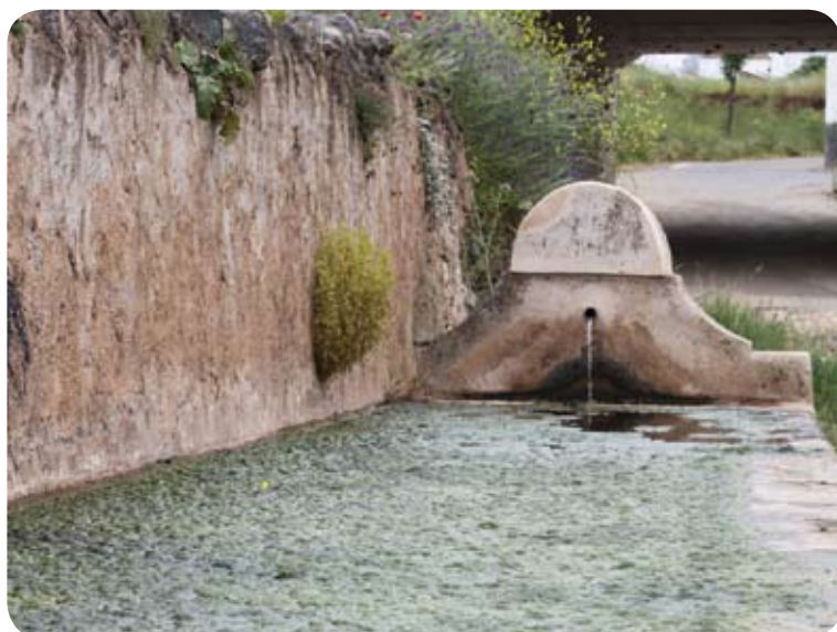
Abrevadero al inicio de la etapa