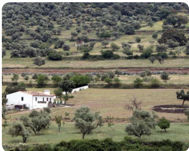
Las parcelas agroganaderas dibujan mosaicos en el paisaje

El camino describe un zig-zag en su bajada hasta que comienza a ensancharse entre parcelas delimitadas por muretes de piedra. La panorámica ofrece el valle del Riofrío atravesado por el ferrocarril Huelva-Zafra que cruzamos en un paso a nivel. En la parte más baja vadeamos donde confluyen dos arroyos y enlazamos con un camino terrizo que tomamos a la izquierda en dirección a la carretera.