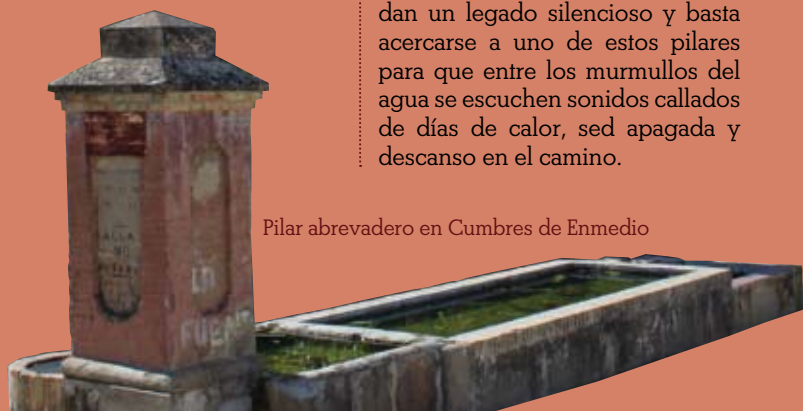
Pilar abrevadero en Cumbres de Enmedio

Pozos, fuentes y abrevaderos guardan un legado silencioso y basta acercarse a uno de estos pilares para que entre los murmullos del agua se escuchen sonidos callados de días de calor, sed apagada y descanso en el camino.